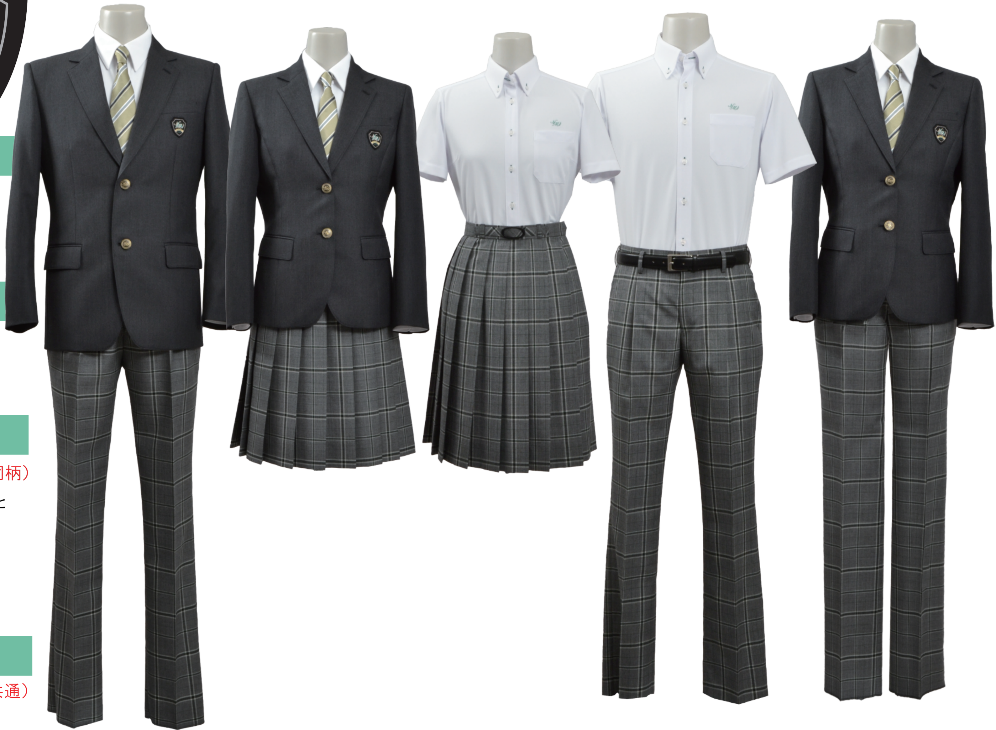
< 女子スラックススタイル >